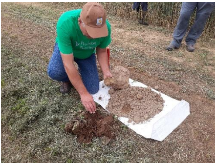
Terre 0-30 cm du système sous couvert (à droite) vs terre mené en système labour

Suite à l'épisode de sécheresse à l'automne 2017, le stock bactérien a été capable de mobiliser plus de 250 uN. Ainsi, Daniel anticipe maintenant sa fertilisation azotée dès le 15 janvier à 100 à 150 unités d'azote, pour « booster » la vie du sol qui sera restitué au printemps. Attention, valable uniquement pour ce type de système.