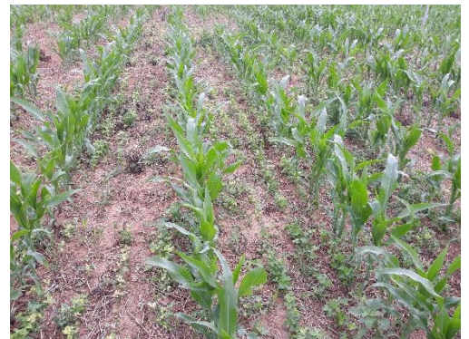
Maïs semé dans du trèfle violet régulé par les désherbants maïs

Guillaume : idem sainfoin. Ne pratique pas.