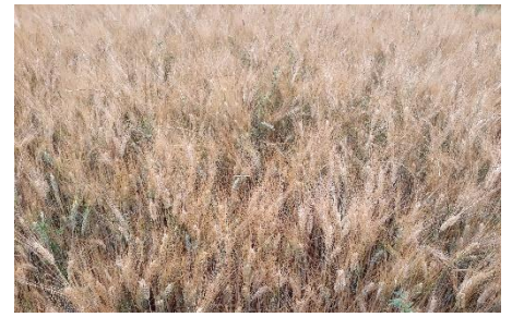
Blé dur semé dans une luzerne régulée à 5-10 au m 2

Variété de blé dur : associe « Anvergur » pour sa productivité sa faible sensibilité aux maladies (résistant rouille jaune) et « Claudio » pour son PS et sa résistance au sec