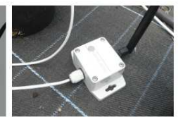
Figure 4 : Sonde connectée avec capteur placé dans le substrat