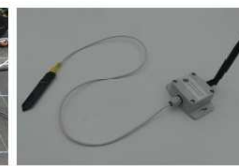
Figure 3 : Sonde connectée et capteur