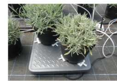
Figure 2 : Balance connectée