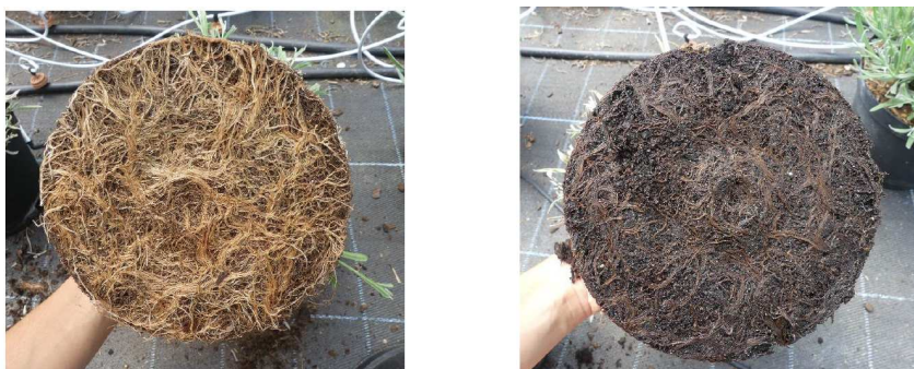
Figure 5: Système racinaire sain (gauche) et atteint par une maladie fongique (droite)