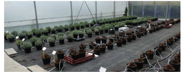
Figure 1 : Parcelle d'expérimentation