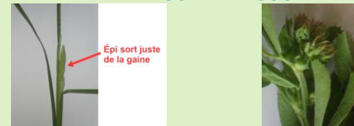
Stade début épiaison