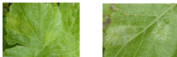
Taches de mildiou en face supérieure à gauche et face inférieure à droite. La sporulation est encore faible