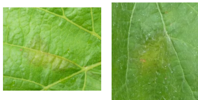
Taches de mildiou en face supérieure. Toutes les taches ne sont pas rondes !

Des taches de mildiou ont été observées cette semaine sur 3 parcelles, dont un témoin non traité. Elles sont encore peu nombreuses, et ne peuvent pas encore être qualifiées d'épidémiques. Cela montre cependant que la pression est bien présente, et qu'il faut être très vigilant, surtout pendant cette période très sensible jusqu'à la floraison. Des contaminations seront possibles lors des pluies orageuses annoncées en début de semaine prochaine. D'après le modèle, le risque serait supérieur dans le Puy-de-Dôme que dans l'Allier.