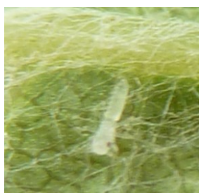
1er stade larvaire de la cicadelle verte

La toute première larve a été observée. Il est encore trop tôt pour estimer la pression.