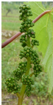
Stade de boutons floraux séparés