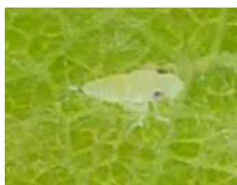
Larves de cicadelle de la flavescence dorée de 1er stade

Les larves de la cicadelle de la flavescence dorée commencent à émerger. Elles sont pour l'instant peu nombreuses et n'ont été observées que sur 2 parcelles d'un même secteur, celui de Louchy (03). Pour rappel, un cep contaminé par la flavescence dorée a été détecté à Saulcet, très proche de Louchy.