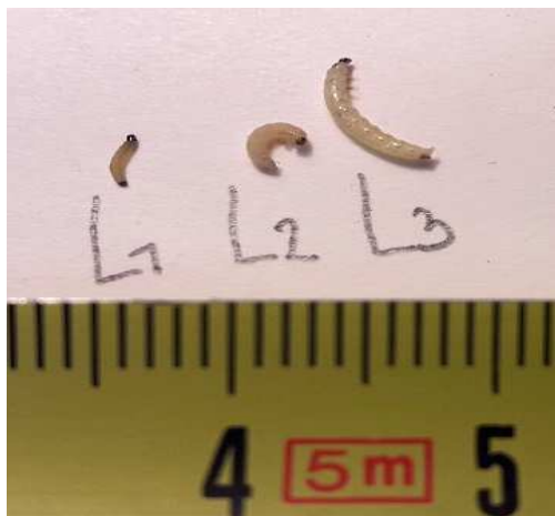
Stades larvaires de grosses altises L1, L2, L3.