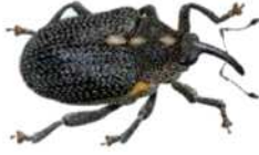
Charançon du bourgeon terminal (Terres Inovia)

Seuil indicatif de risque : aucun seuil pour ce ravageur.