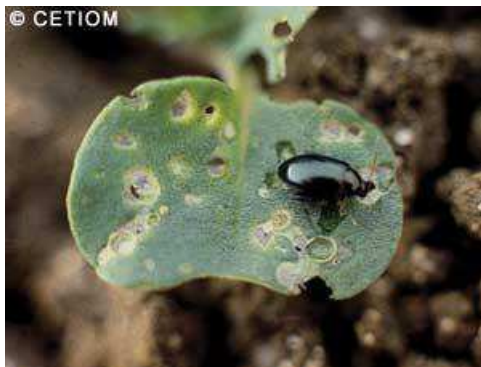
Adulte de grosse altise