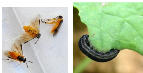
Tenthrede à l'état adulte (gauche) et larvaire (droite)

La tenthrede est un hyménoptère qui à l'état adulte mesure 7 à 8 mm, présente un corps jaune orangé, à tête noire et aux ailes membraneuses. La larve mesure 20 à 50 mm. Elle est translucide, grisâtre voire verdâtre. Elle prend un aspect noirâtre en fin de développement et devient nuisible pour la culture en dévorant les feuilles.