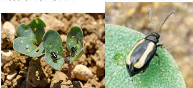
Petites altises noires du colza (gauche) et bicolore (droite). Morsures circulaires visibles

Il s'agit d'un petit coléoptère noir ou bicolore (noir, avec 1 ou 2 bandes longitudinales jaunes sur chaque élytre). Il mesure 2 à 2.5 mm.