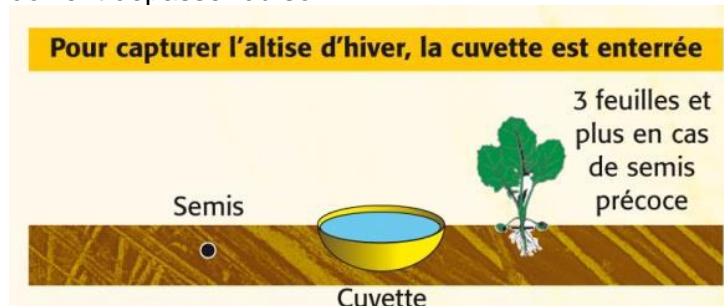
Schéma de la disposition de la cuvette jaune pour capturer l'altise d'hiver.

L'altise d'hiver fait exception à cette règle. En effet, il s'agit d'un insecte qui se déplace par des sauts. L'objectif est donc de capturer l'insecte lorsqu'il se déplace en enterrant la cuvette dans le sol. Seule 1-2 cm de rebord doivent dépasser du sol.