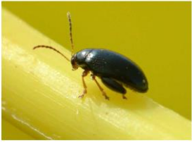
Grosse altise adulte