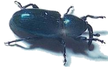
Baris (Terres Inovia)

Attention à ne pas confondre le CBT avec le baris des crucifères. Le baris présente un rostre beaucoup plus recourbé et sa nuisibilité pour la culture n'est pas avérée.