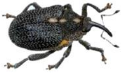
Charançon du bourgeon terminal (Terres Inovia)

Le CBT adulte mesure de 2.5 à 3.7 mm. Corps brillant et noir avec une pilosité courte clairsemée. Tâches latérales blanches entre le thorax et l'abdomen. Extrémités des pattes rousses.