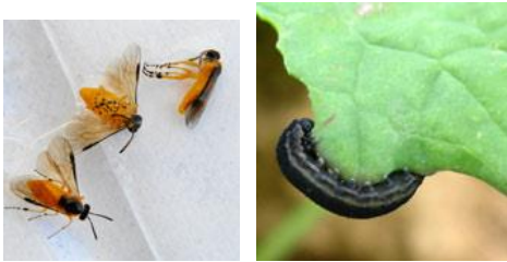
Tenthrede à l'état adulte (gauche) et larvaire (droite)

La tenthrede est un hyménoptère qui à l'état adulte mesure 7 à 8 mm, présente un corps jaune orangé, à tête noire et aux ailes membraneuses. La larve mesure 20 à 50 mm. Elle est translucide, grisâtre voire verdâtre. Elle prend un aspect noirâtre en fin de développement et devient nuisible pour la culture en dévorant les feuilles.