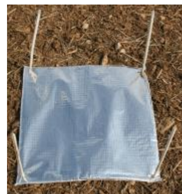
Piège à limace.

Cette observation nécessite une attention particulière. En effet, le relevé des pièges doit s'effectuer en début de matinée en conditions fraîches et humides et en «grattant» la terre sous les pièges car les limaces sont généralement abritées entre les mottes dans les premiers cm du sol.