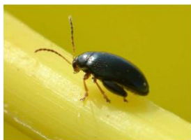
Grosse altise adulte

Il s'agit d'un gros coléoptère de 3 à 5 mm de long au corps noir et brillant avec des reflets bleus métalliques sur le dos. Les extrémités des pattes, des antennes et de la tête sont roux dorés. Elle est reconnaissable aussi par des « grosses cuisses » qui lui permettent de sauter pour se déplacer dans la parcelle.