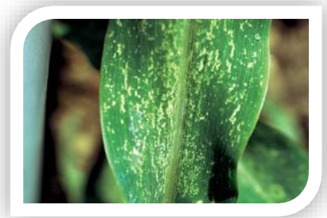
Photo 2 : ponctuations blanches provoquées par la cicadelle

La présence de cicadelle verte est signalée sur 7 parcelles du réseau cette semaine. Des ponctuations blanches caractéristiques de la cicadelle sont observées sur toutes les feuilles, même les plus jeunes (photo 2 ci-contre). La nuisibilité peut devenir significative lorsque la feuille de l'épi commence à porter des traces blanches. Cette cicadelle ne transmet pas de virus.