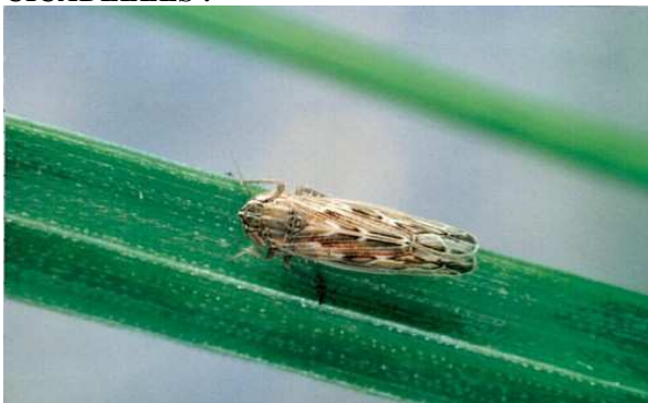
Cicadelle adulte (spantettix alienus)

5 bandes blanches étroites 6 bandes beiges larges longitudinales sur le sommet de la tête caractéristiques de l'espèce Des ailes disposées en forme de toit (^) Tibia postérieur avec de nombreuses épines caractéristiques de la famille Taille réelle : 3,9 - 4,4 mm