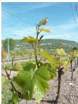
Stade le plus précoce

Les stades phénologiques n'ont que très peu évolué depuis 2 semaines. Il existe une grande hétérogénéité au sein des parcelles avec souvent de 1 feuille à 4 feuilles étalées. Les grappes sont bien visibles mais sont encore très petites. La hausse des températures annoncées pour ces prochains jours devrait permettre le déblo-cage de la pousse et l'allongement des grappes.