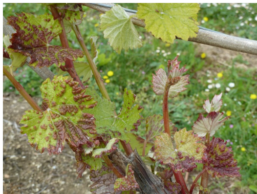
Cep très touché par l'erinose. Cas isolé !

Erinose : Les sorties d'erinose paraissent assez importantes cette année parce que les feuilles sont encore très peu nombreuses et petites. Les boursoffures d'erinose sont donc « concentrées ». Avec la reprise de la pousse, les symptômes vont se diluer. L'erinose est la plupart du temps sans conséquence pour la vigne. La présence de typhlodromes permet de réguler la maladie : ils sont prédateurs des acariens responsables des boursoffures.