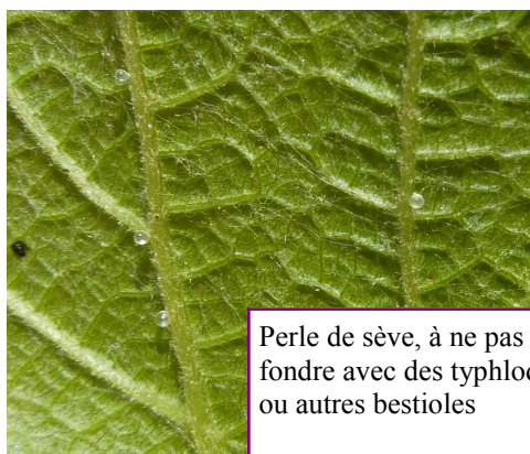
Perle de sève, à ne pas confondre avec des typhlodromes ou autres bestioles