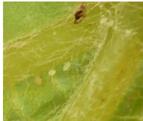
Typhlodromes. Ils sont visibles à l'œil nu, mais c'est plus aisé à l'aide d'une loupe