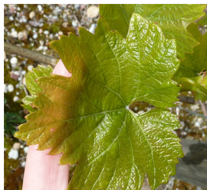
Feuille « translucide », stressée par le froid