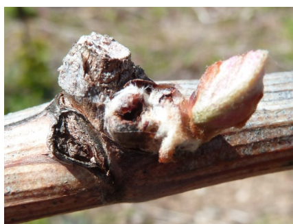
Bourgeon évidé par un mange-bourgeon à gauche, contre-bourgeon prenant le relais

Bulletin rédigé par les Chambres d'Agriculture de l'Allier et du Puy de Dôme, en collaboration avec le syndicat des viticulteurs de Saint Pourçain, la Fédération viticole du Puy de Dôme, et les viticulteurs du vignoble Saint Pourcinois et des Côtes d'Auvergne. Action pilotée par le ministère chargé de l'agriculture, avec l'appui financier de l'office nationale de l'eau et des milieux aquatiques, par les crédits issus de la redevance pour pollutions diffuses attribués au financement du plan Ecophyto".