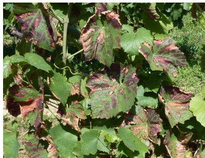
Forme lente de maladie du bois : les symptômes apparaissent lentement. Les décolorations rouges (pour les cépages rouges) apparaissent entre les nervures principales

On observe de nombreux ceps atteints de la forme lente ou apoplectique. Pensez à les repérer pour pouvoir les supprimer ou les reposer cet hiver.