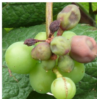
Attaque récente de mildiou sur un grappillon; faciès rot brun