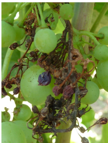
Attaque ancienne de mildiou sur grappe

Les grappes ne présentent quant à elles plus de risques de contaminations.