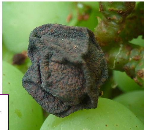
Baie momifiée avec les pycnides caractéristiques.