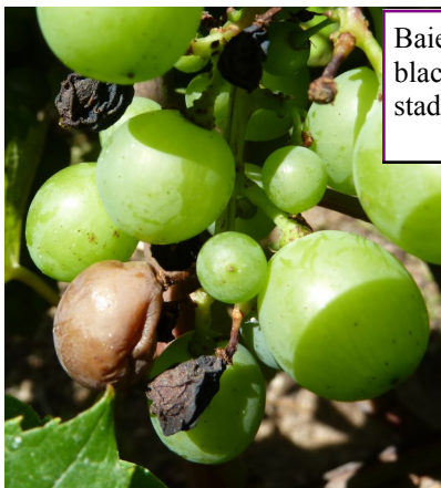
Baies touchées par le black rot à différents stades

Mais on reconnaît à coup sûr le black rot à la présence de pycnides (points noirs, comme sur les taches des feuilles) sur les baies sèches. Ces pycnides sur les baies momifiées restent tout hiver, et constituent l'inoculum pour l'année suivante.