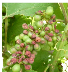
Dégâts de grêle

Des orages ont sévi la semaine dernière avec localement d'importants dégâts de grêle. C'est notamment la cas à Meillard (03).