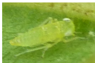
Larves de cicadelles vertes à différents stades

Dans la grande majorité des cas, leur nombre est faible. Seules 2 parcelles sur les 30 observées voient le seuil dépassé avec 81 et 115 larves pour 100 feuilles