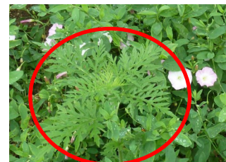
Ambroisie à feuille d'armoise

http://draaf.auvergne-rhone-alpes.agriculture.gouv.fr/IMG/pdf/Note_nationale_BSV2014_ambrosies_cle889edb.pdf