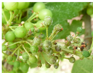
Symptômes sur grappe

S'il y a eu contaminations lors des pluies de la semaine passée, les symptômes devraient être visibles à partir de la fin de cette semaine.