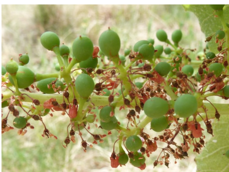
Grappe présentant de la coulure

Le millerandage est due à une fécondation imparfaite de la fleur : le grain est formé mais ne se développe pas normalement et reste plus petit.